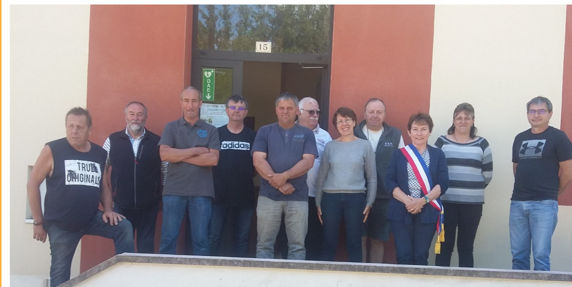
Elections Municipales du 15 mars 2020